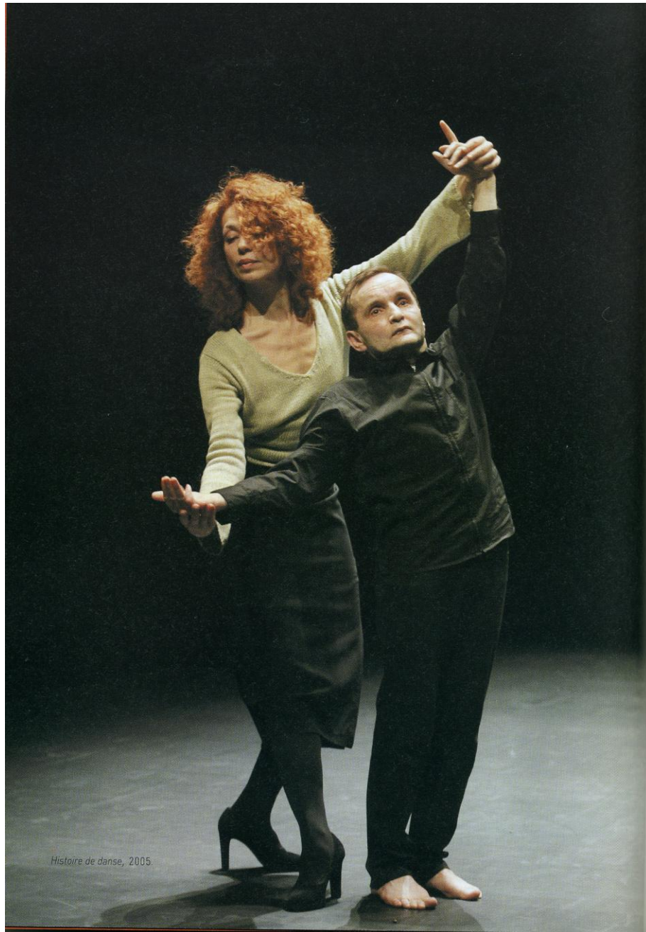
Histoire de danse, Raimund Hoghe, 2005