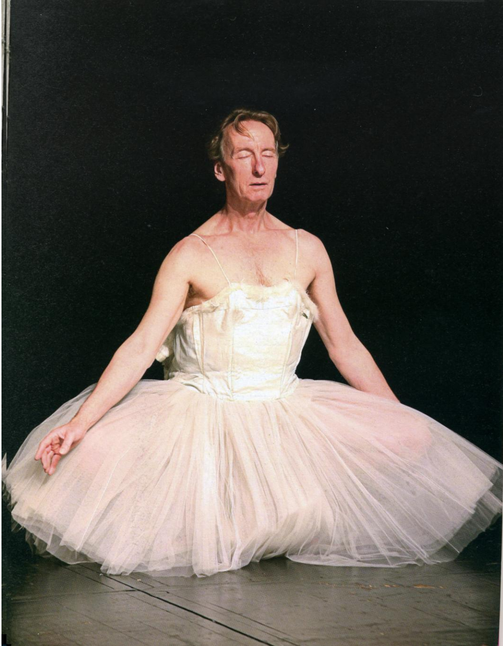
Bandonéon , Pina Bausch, 2007